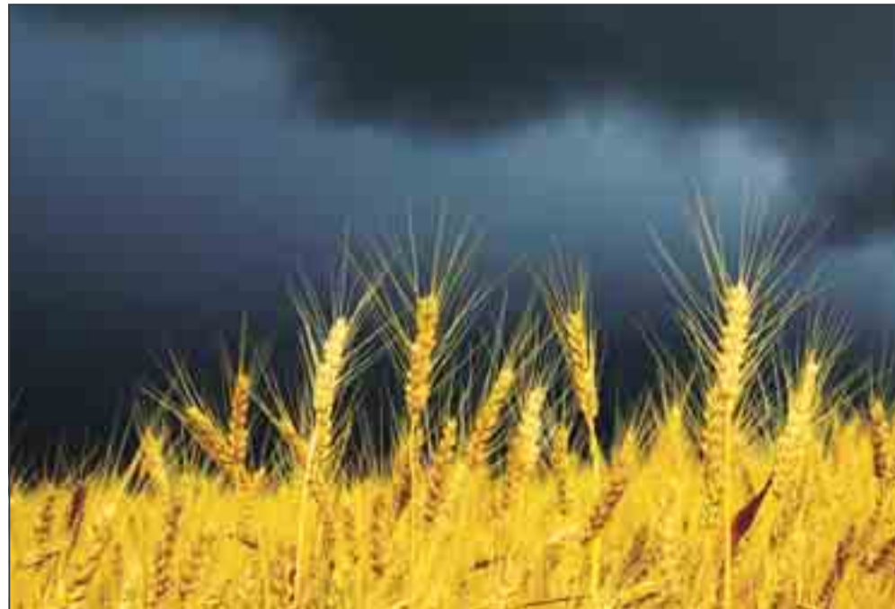
Regn som en økonomisk risikofaktor kan helt fjernes. Midlet hedder et vejrcertifikat, som kan skræddersys.

Certifikatet er ikke afgrødeforhængigt, og summen udbetales, uanset hvordan det går